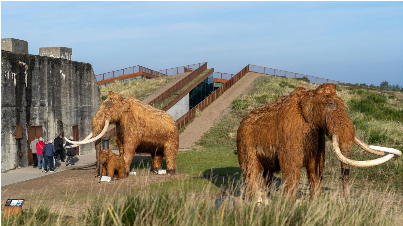
Tirpitz museum og bunker set udefra

Så går turen til "Tirpitz", hvor vi får en introduktion samt tid på egen hånd til at gå på opdagelse i fortællinger om den imponerende krigsmaskine, forliste skibe, farlige smuglere og forbudt kærlighed samt særudstillingen "Den sidste mammut – det første menneske".