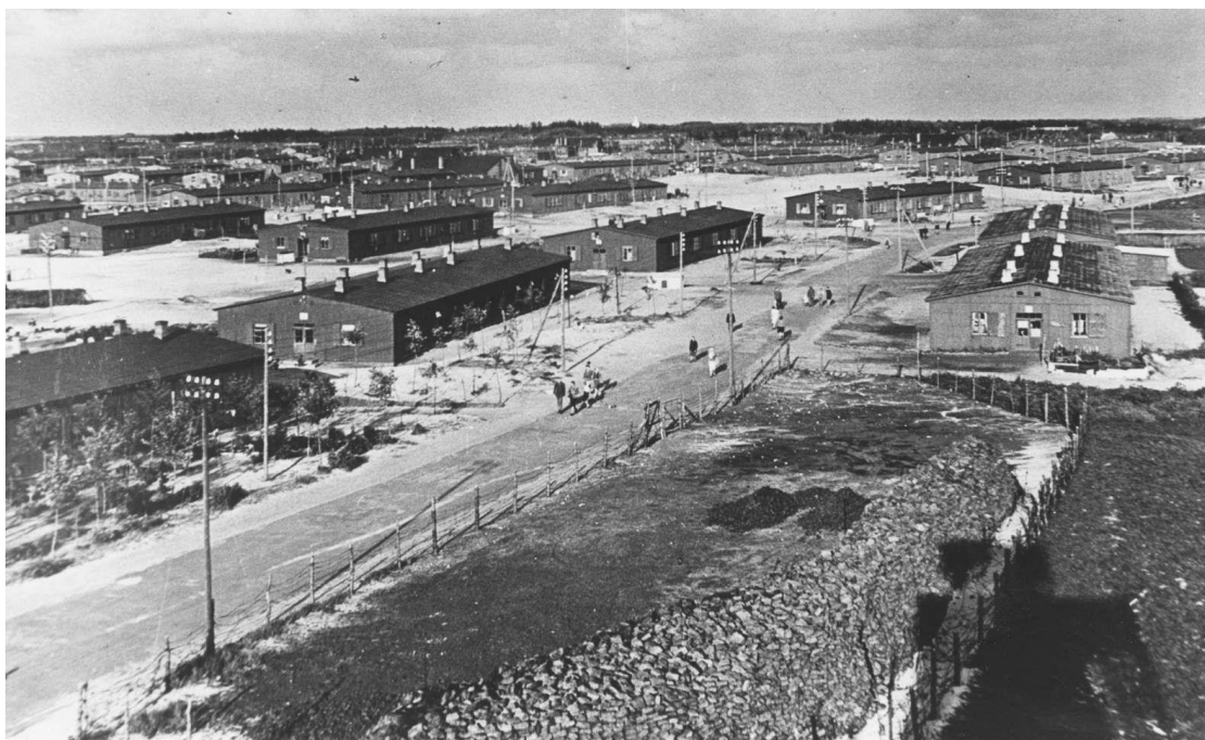
Danmarks største flygtningelejr, Oksbøl

Man kan fundere over, hvad "hjem" er og hvad et liv på flugt gør ved ens fremtidsdrømme. Bag hvert menneske på flugt gemmer sig en unik historie om et liv i krig, kærlighed og familieliv.