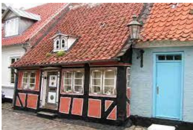
Dukkehuset i Ærøskøbing

Efter frokost kører vi til Ærøskøbing, hvor der er tid på egen hånd til at nyde de smukke gader og huse, hvoraf mange er fredede. Der er mulighed for at købe sig en kop kaffe og lagkage.